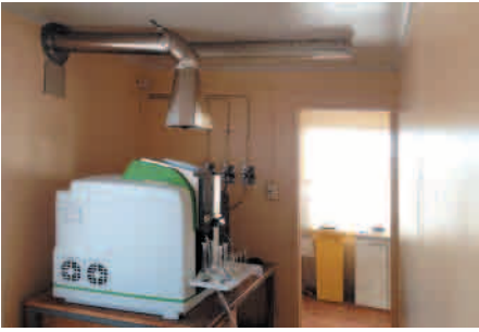
Equipo de Absorción Atómica Pinnacle 900 F.

un tremendo problema, ya que un análisis hecho con agua contaminada nos haría incurrir en grandes errores con serias consecuencias dentro de la Planta. Significaría además tomar decisiones incorrectas por parte de Operaciones, y adicionalmente, el cloruro produce corrosión en la Nave Electrolítica, destruyendo las placas con el despegue de cátodos. Siempre debemos trabajar con agua purificada de buena calidad Tipo II.