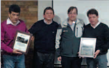
FAENA CABILDO CUMPLE 1 AÑO SIN ACCIDENTES CTP