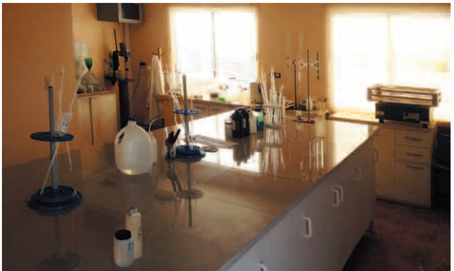
Ampliación del Laboratorio Mesón Central.