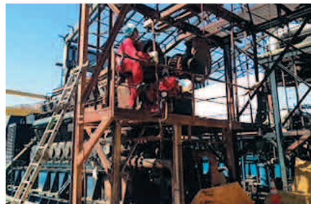
Desarme estructuras soporte silenciadores y salida de gases.

Mayo y junio 2015, material estructuras, taller empresa Madelnor.