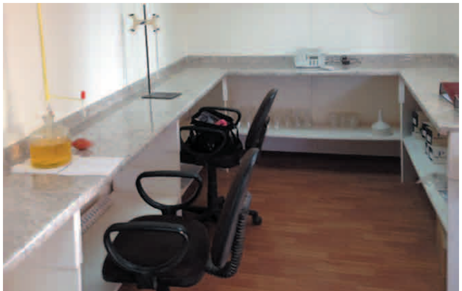
Container especial para Laboratorios Químicos.