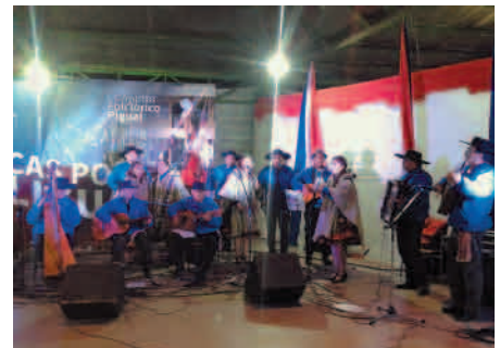
Aniversario de ciudad de La Ligua N° 261.

Como cada año, el Conjunto Folklórico Las Cenizas participa en diversas festividades a lo largo de nuestro país. En esta ocasión la agrupación se destacó con cantos y bailes típicos.