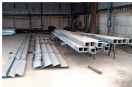
Costaneras y perfiles diagonales.

Mayo y junio 2015, material estructuras, taller empresa Madelnor.