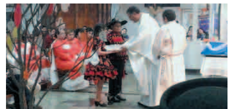
En la misa, por la procesión de sor Teresa de Los Andes.