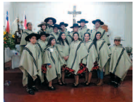
Misa de la Virgen del Carmen.