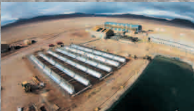
PROYECTO SISTEMA SOLAR TÉRMICO