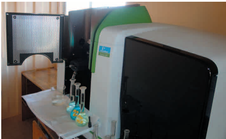
Equipo de Absorción Atómica Pinaacle 900 F.

Con el nuevo EAA (Pinaacle 900 F) se tuvo que instalar una red de gases bajo normas, inversión necesaria para protección del equipo y exigencia mínima de nuestro proveedor Perkin Elmer para dejarlo en funcionamiento. Podemos decir que tenemos mayor confianza, seguridad, rapidez en la entrega de resultados. Hoy tenemos ad portas un curso avanzado para profesionales químicos, que lo desarrollaremos en la segunda quincena de julio 2015.