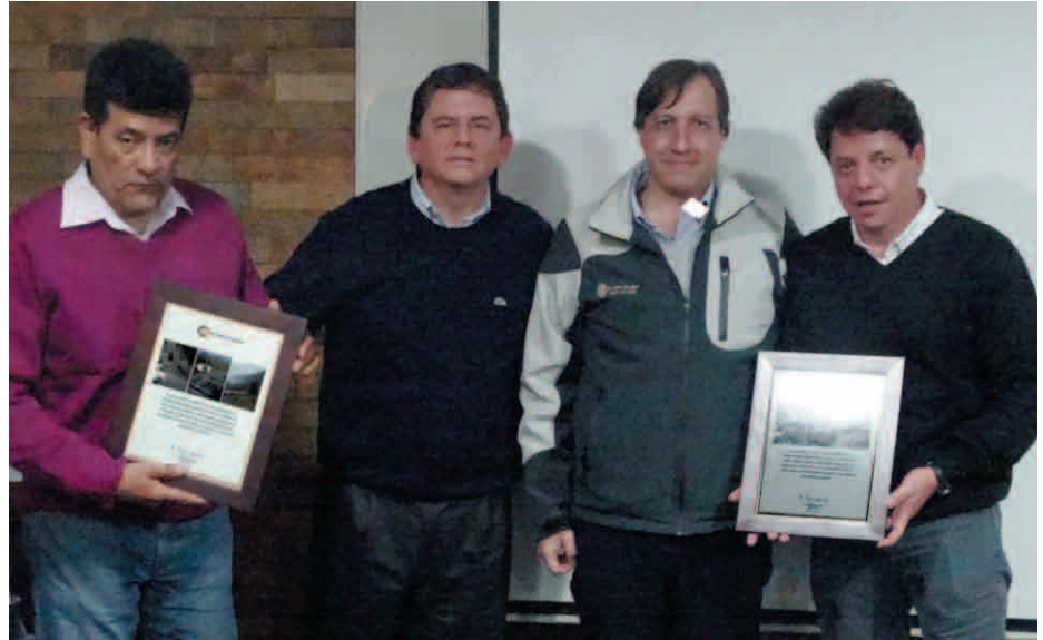
Entrega de reconocimiento por parte de la Gerencia General a Faena Cabildo.