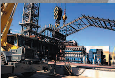
RECONSTRUCCIÓN DE LA CENTRAL ELECTRICA CENIZAS