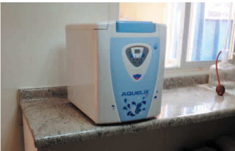
Purificador de Agua: Aquelix 5 Merck.

El agua exenta de cloruros es un elemento esencial dentro del Laboratorio Químico de Planta de Óxidos, crítico para el análisis de este elemento. No contar con ella nos provocaría