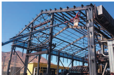
Retiro costaneras techo.

En términos generales, esta actividad y sus obras no implican una alteración en las características propias del proyecto original, salvo las naturales mejoras en equipos menores y periféricos, que serían eventualmente actualizados por equipos más modernos y eficientes.