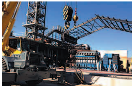
Retiro de portales.