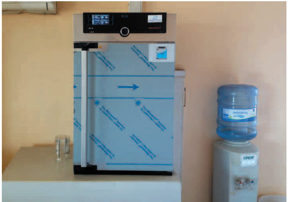
Horno de secado MEMMET 0,75.

Este horno era muy necesario no sólo para secar nuestro material de vidrio, que se usa para hacer el análisis de cloruro, también para realizar el análisis de sólidos en suspensión y para el análisis de sulfato. Y sobre todo para las distintas pruebas del Área de Metalurgia. ☺