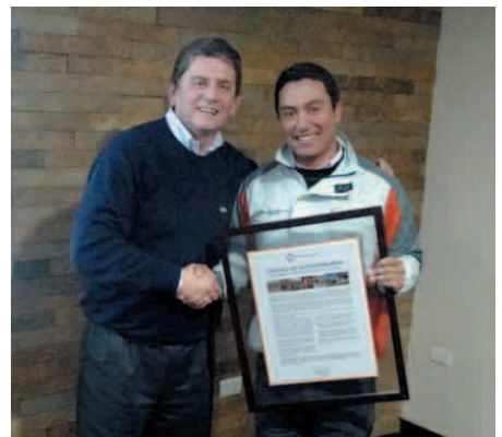
Entrega Política de Sustentabilidad.