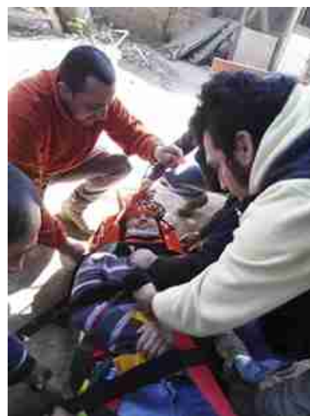
Inmovilización de accidentado, Brigadistas Mina Don Jaime y Carmen.