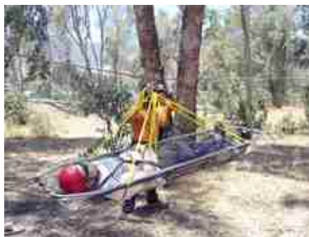
Traslado de accidentado en altura Brigadistas Cenizas y Orion.