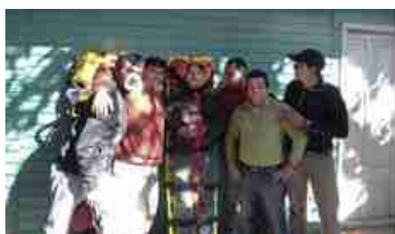
Brigadistas de Mina Carmen Margarita y Mina Don Jaime.

Uno de los temas que comenzamos a profundizar con los brigadistas fue el de Primeros Auxilios, donde con el apoyo de la Asociación Chilena de Seguridad (ACHS), se les capacitó en técnicas de primeros auxilios, maniobras de reanimación cardiopulmonar, utilización de desfibrilador, traslado de accidentado, inmovilización de extremidades con férulas y uso del cuello ortopédico.