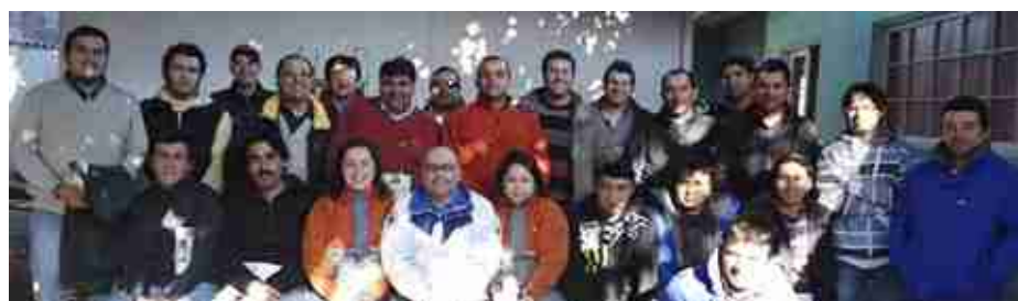
Brigadistas Mina Don Jaime, Mina Sauce, Mina Carmen Margarita y Planta.