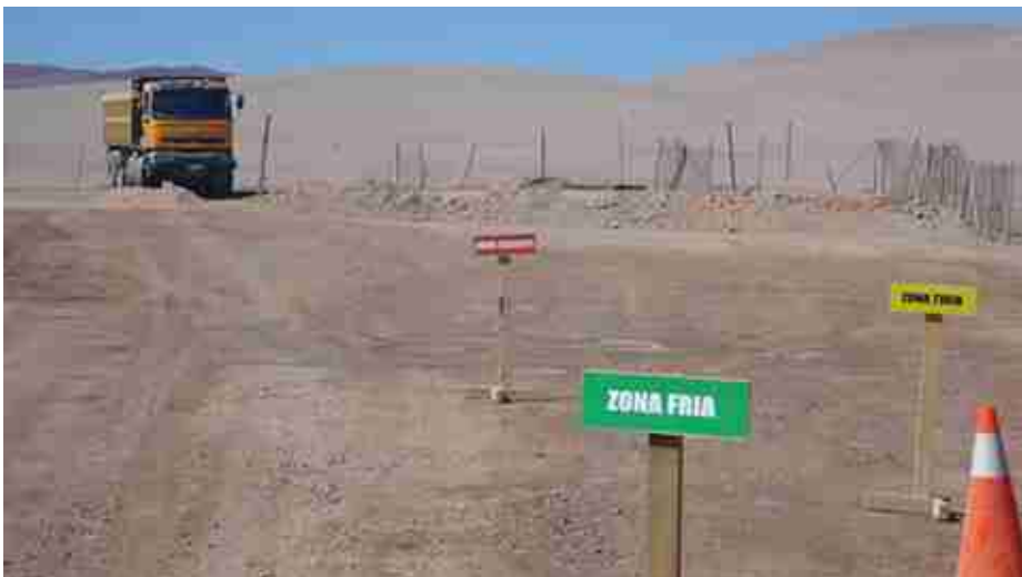
Delimitación de zonas de seguridad.