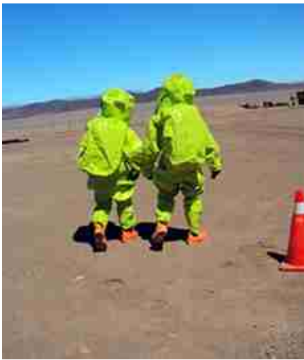
Prácticas de brigadistas encapsulados.