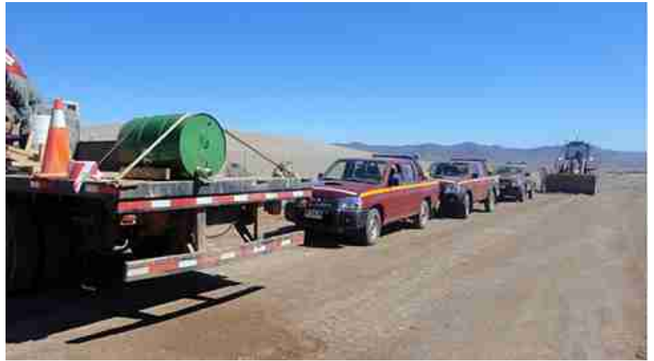
Logística empleada durante el simulacro.