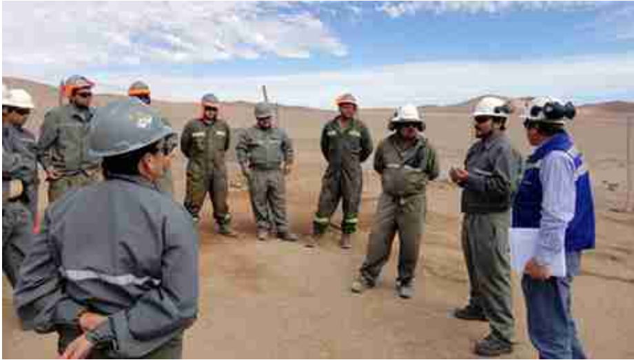
Reunión de planificación en terreno.

En faena Taltal, el 24 de abril pasado se llevó a cabo en la Planta de Óxidos el Primer Simulacro de Emergencia, que supuso el volcamiento de un camión de transportes con fuga de ácido sulfúrico al interior de la Planta.