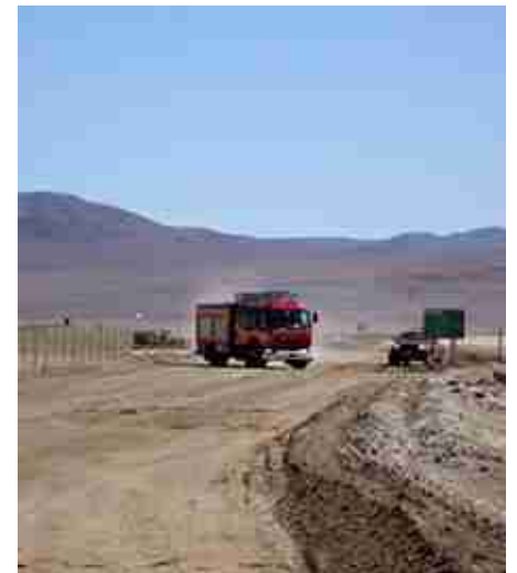
Llegada del Cuerpo de Bomberos.