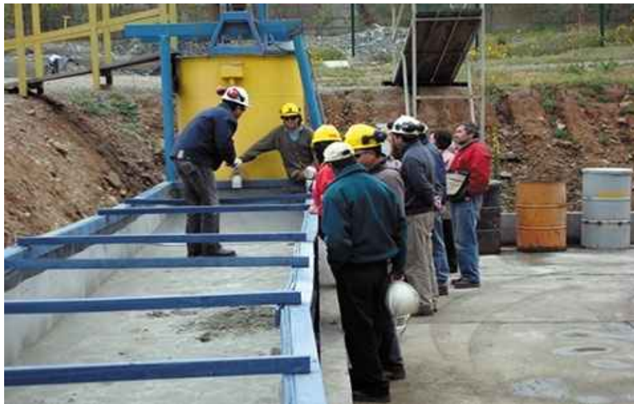
Comunidad observa demostración en Planta Piloto.

El proyecto DEP se encuentra en la etapa de construcción, periodo que culminará en diciembre de este año, con