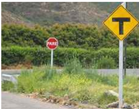
Obras de vialidad realizadas a través del Estudio de Impacto Vial.

infraestructura vial, como la reparación de los baches existentes en calle Nueva de Peñablanca, reforzamiento de la señalética vertical de la Ruta E-425 (Calle Nueva) y barreras de contención en los cruces de caminos.