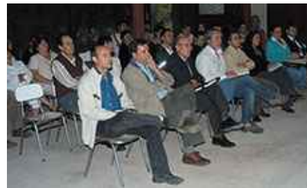
Conformación de mesa de trabajo.

A la fecha, la comunidad de Peñablanca ha efectuado dos visitas al área de emplazamiento del Proyecto DEP: la primera en septiembre de 2009 y la segunda en julio de 2010.