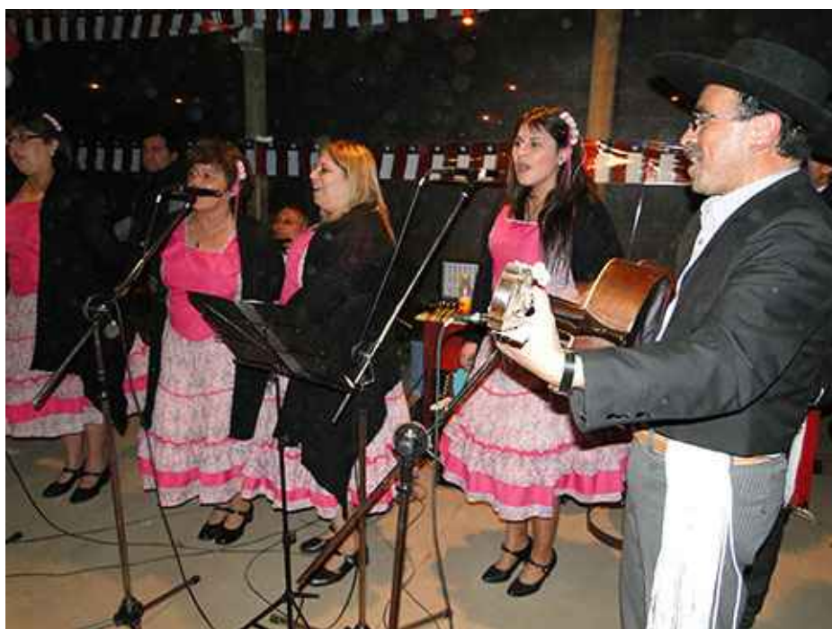
Grupo Folklórico Las Cenizas.