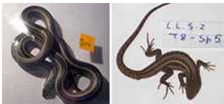
Actividad de Rescate de Fauna y Micromamíferos.