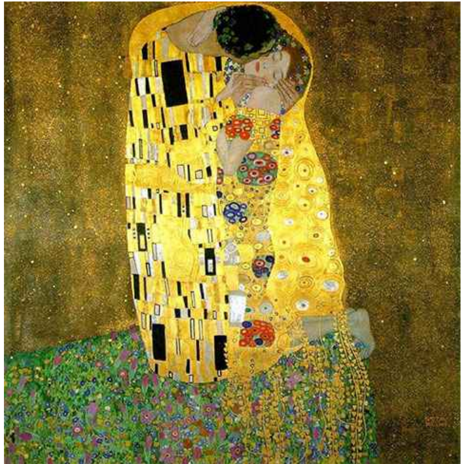
El beso, Gustav Klimt (1907-8).

De este modo sabemos que el mundo de la mujer es el mundo de la ternura, es el mundo del amor, por eso junto a ellas podemos nosotros crecer, podemos