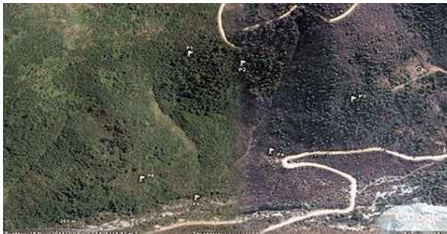
Imagen Satelital: zona de Exclusión y Parcelas Permanentes.