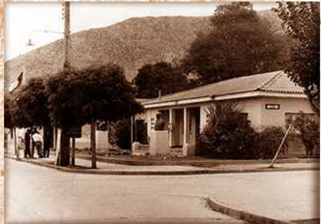
Antigua Municipalidad Cabildo.