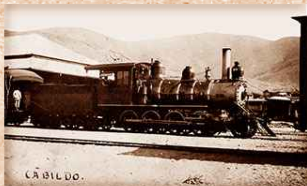
Antigua Estación Cabildo.