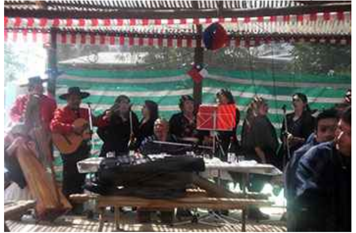
Grupo Folclórico Las Cenizas.