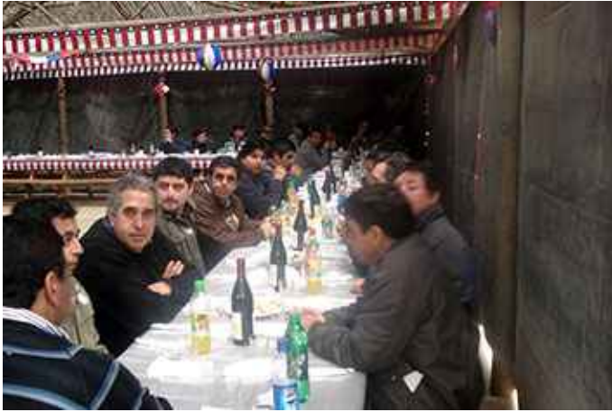
Vista general de algunos asistentes.