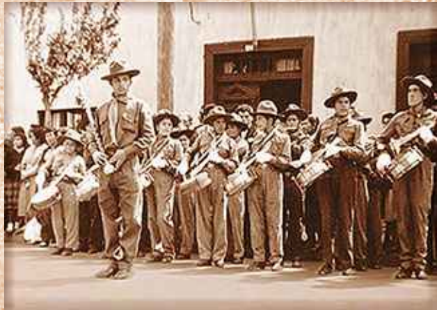
Banda Escuela Fiscal Cabildo.