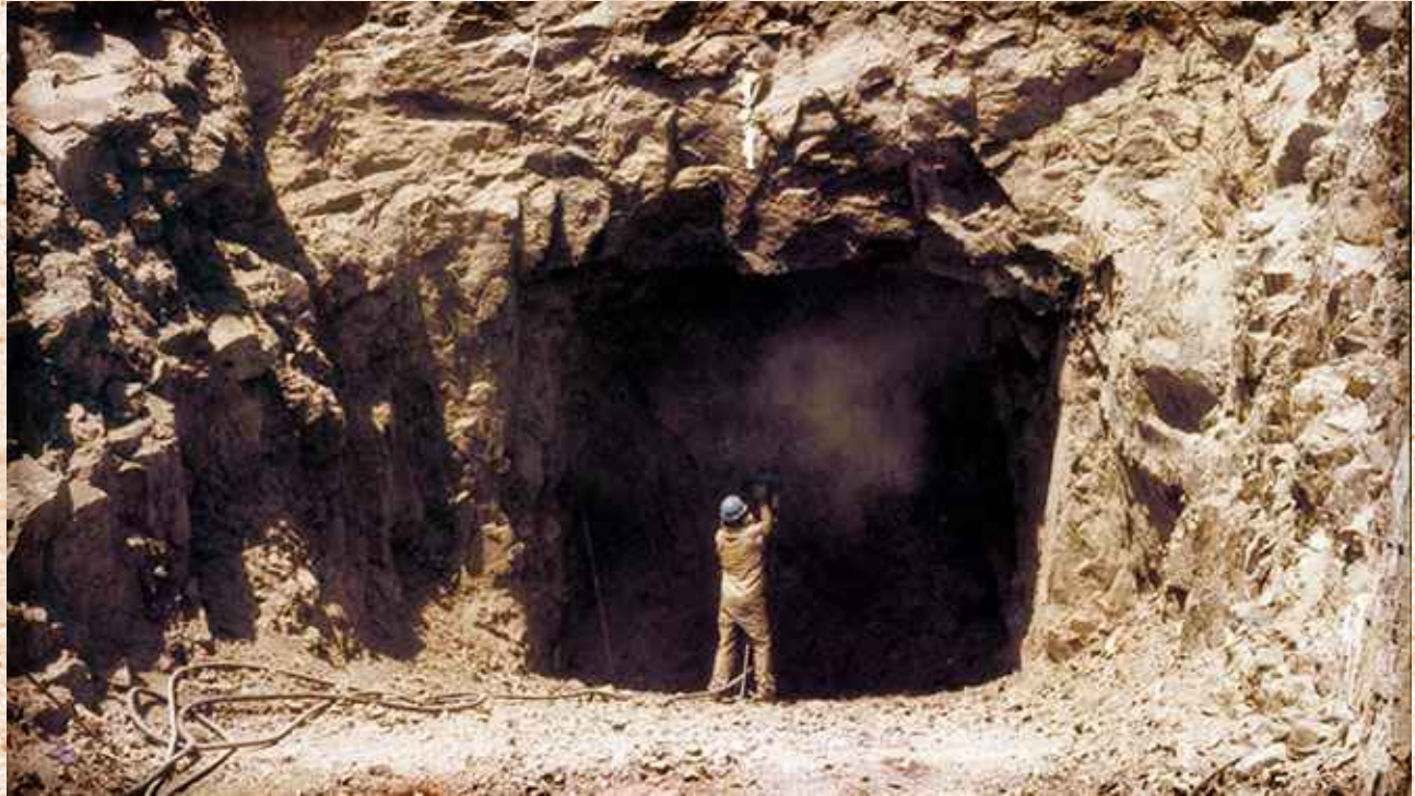
Taltal, 8 de enero de 1994. Mina Las Luces.