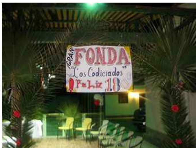
Fonda Los Codiciados.