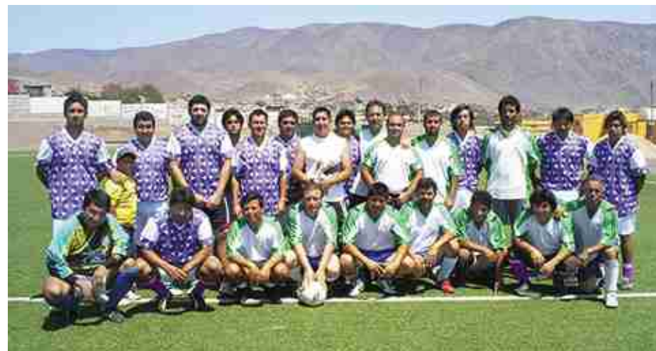
La imagen muestra los Bomberos con camiseta color violeta, y el equipo de Minera Las Cenizas usando camisetas de color verde.

En Taltal, el pasado 17 de marzo (2009) se formó el Club Deportivo de Minera Las Cenizas, el cual se constituyó con un total de 64 socios, quienes actualmente se desempeñan como trabajadores en nuestra compañía.