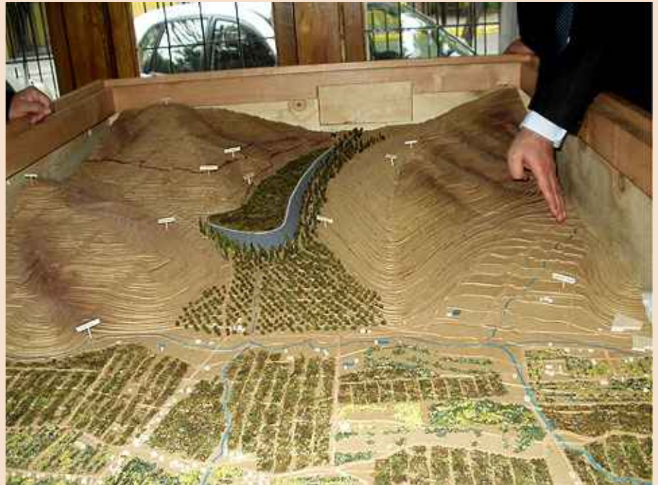
Maqueta Depósito de Pasta Cabildo con vegetación.

Básicamente, la opción propuesta consiste en construir un depósito de pasta en la ladera nor-oriente de la Que-