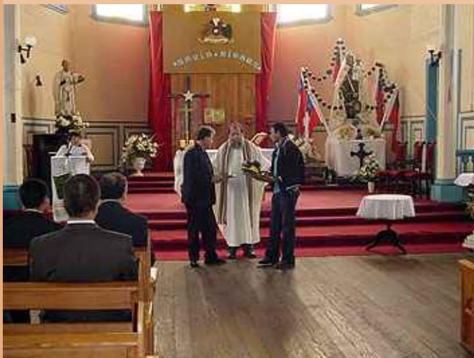
Celebración de la Misa.