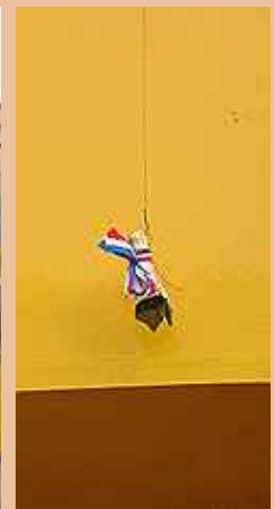
Jefatura, funcionarios y contratistas - 12 de octubre 2006