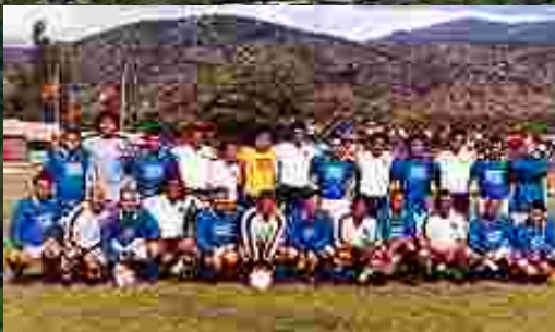
Alhué 2003. Inauguración cancha de fútbol Complejo Deportivo. Florida vs. Colo. Colo.