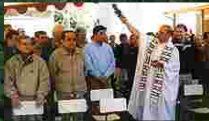
Alhué, julio 2000. Inauguración planta de lixiviación.