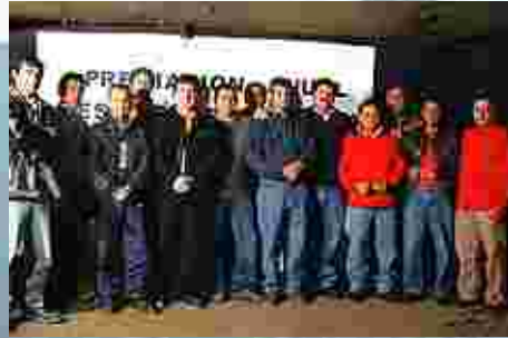
Alhué. Premiación Anual Gestión Preventiva.