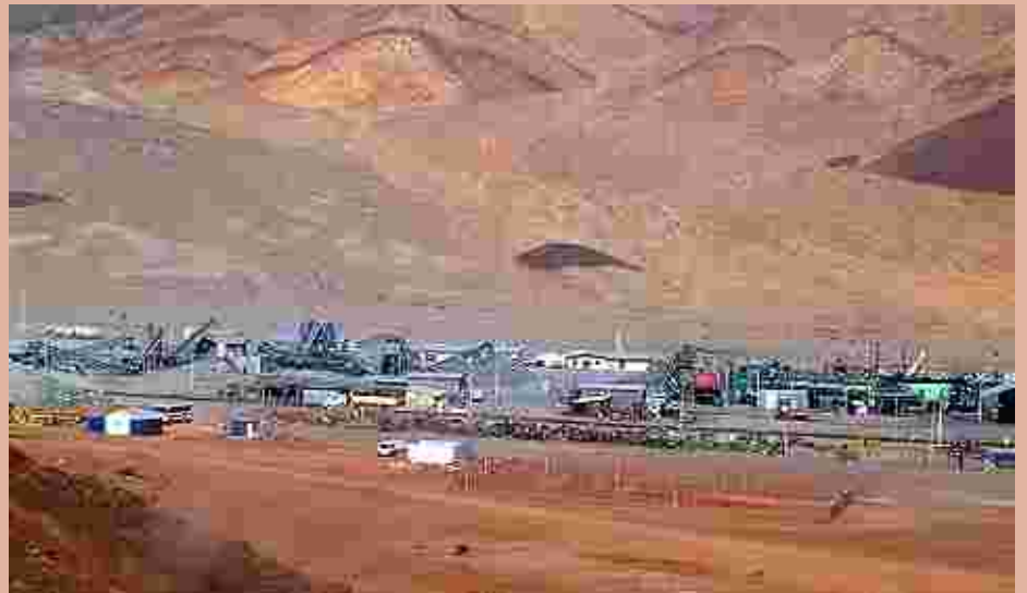
Mirando la Planta desde el nuevo tranque.